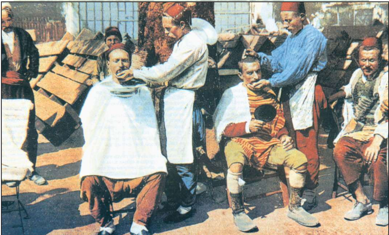
Πλανόδιοι μπαρμπέρηδες σε πλατεία στα τέλη του 19ου αιώνα. Καρτ ποστάλ